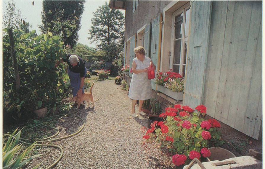
Devant la maison de Collonge-Bellerive: avec son épouse et la chatte Fifi.

Des bateaux, il en a réparé des quantités. Ici, dans son atelier.