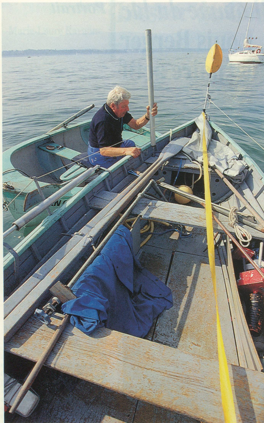
Le bateau est amarré au large afin de prévenir les actes de vandalisme...

La flore du lac a complètement changé à la suite de la grave pollution. En fait, ce n'est pas vraiment nocif pour les poissons, mais bien plutôt pour les oeufs.