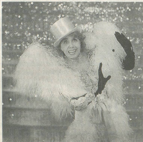
Mistinguett au Casino de Paris en 1937. Elle a 62 ans...

Jean Cocteau a dit d'elle: «Cette tragédienne qui résume notre ville parce que sa voix poignante vient des cris des marchandes de journaux, de la marchande des quatre-saisons»... Tragédienne cette vedette internationale du music-hall doublée d'une exceptionnelle meneuse de jeu? Venant de Cocteau, le mot est puissant, même s'il s'applique à Mistinguett.