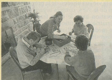
Préparation du repas au Relais.