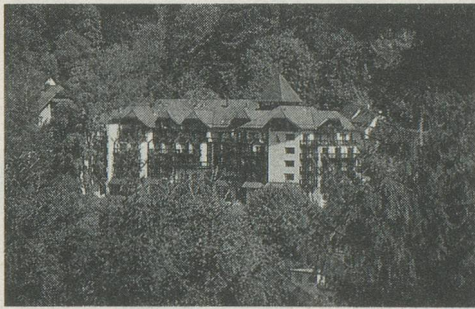
Le Schwarzwald Kulm Hôtel à Bad Herrenalb: un palace à l'orée de la grande forêt.