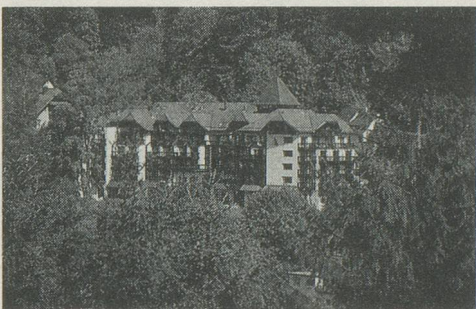
Le Schwarzwald Kulm Hôtel à Bad Herrenalb: un palace à l'orée de la grande forêt.