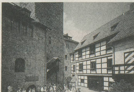
Le Château de Liebenzell fut construit au début du XIII e siècle par les comtes d'Eberstein pour protéger leurs terres situées au bord de la Nagold. Après réfection, un centre de rencontres et de coopération pour la jeunesse européenne s'y installa. Ce centre est à l'origine du Forum international de Burg Liebenzell dû en 1953 à G.-A. Gedat, D' h.c. Des jeunes du monde entier sont venus bénévolement travailler à la rénovation de l'auguste demeure.

Bad Herrenalb, une petite ville bien aérée, enchâssée dans la somptuosité de la Forêt-Noire.