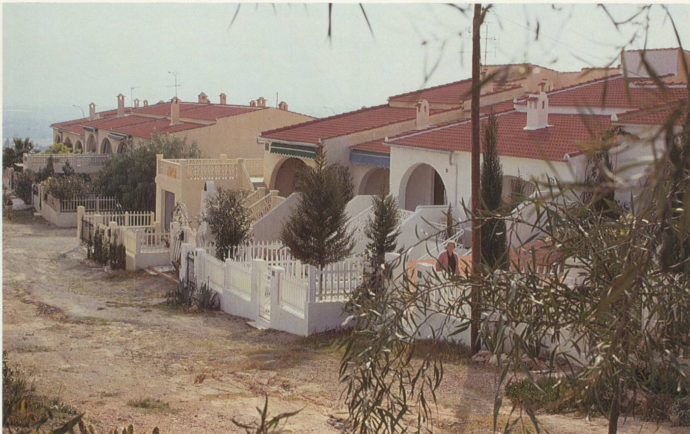
Des bungalows, oui, mais la rue n'a toujours pas été aménagée...

un poulet entre Fr.s. 3.- et Fr.s. 5.50 le kg, la côte de bœuf Fr.s. 21.- le kg et les tomates 14 centimes le kg, on comprend l'intérêt de vivre là-bas, le tout pouvant être arrosé d'un excellent vin rouge à Fr.s. 3.- la bouteille ou un rosé en brique à Fr. 1.25, on n'hésite plus à changer de vie. Sur le plan de la santé, le climat est excellent pour prévenir les rhumatismes, un élément qui est non seulement un très bon argument pour les promoteurs, mais également apprécié des nouveaux résidents. Malheureusement, sur les quelque 1200 retraités, environ 400 d'entre eux sont ce que l'on pourrait appeler des «réfugiés économiques», c'est-à-dire qu'ils n'avaient pas d'autre choix, s'ils voulaient profiter d'une vie agréable pendant leur retraite. A 65 ans, ils ont investi le fruit de leur caisse de retraite ou leurs