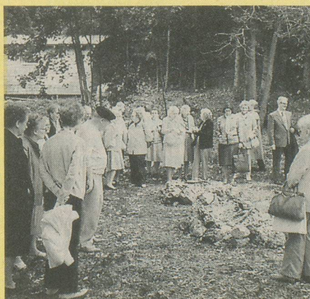
Il n'y a pas de torrée sans feu...