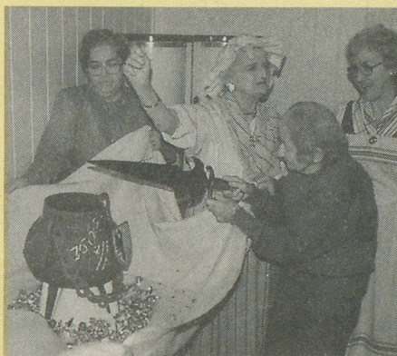
La marmite de l'escalade.

L'échange de ces traditions a rencontré un vif succès, cela nous a donc encouragés à récidiver et nous prévoyons d'aller à la découverte d'autres traditions qui se traduisent par une manifestation ou une fête!