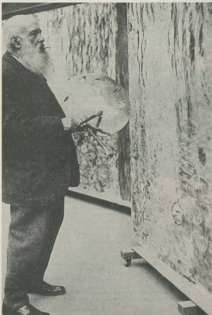
A 80 ans, Claude Monet, le peintre de la lumière, travaillant aux «Nymphéas».