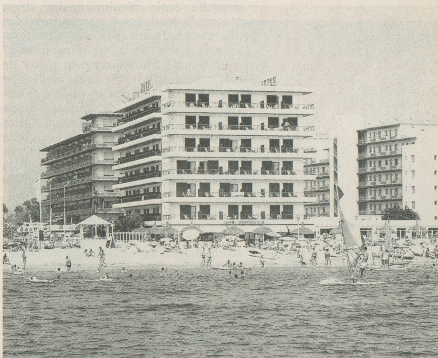
Hôtel Monte-Carlo, Rosas

Et, bien sûr, nous retournons à Rosas (Espagne), un de nos grands succès!