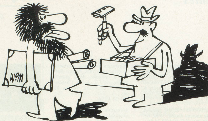
Sans paroles. Dessin Moese, Cosmopress Genève

Ne pas utiliser ce coupon pour le renouvellement de l'abonnement.