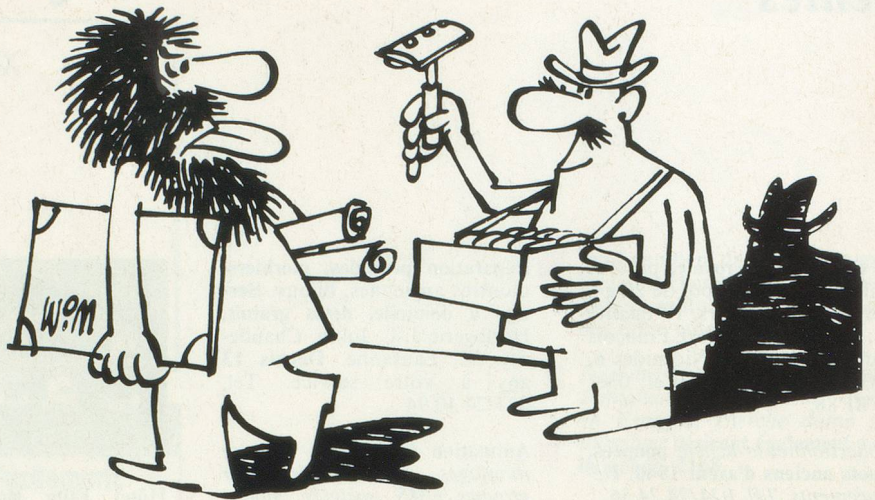
Sans paroles. Dessin Moese, Cosmopress Genève

Ne pas utiliser ce coupon pour le renouvellement de l'abonnement.