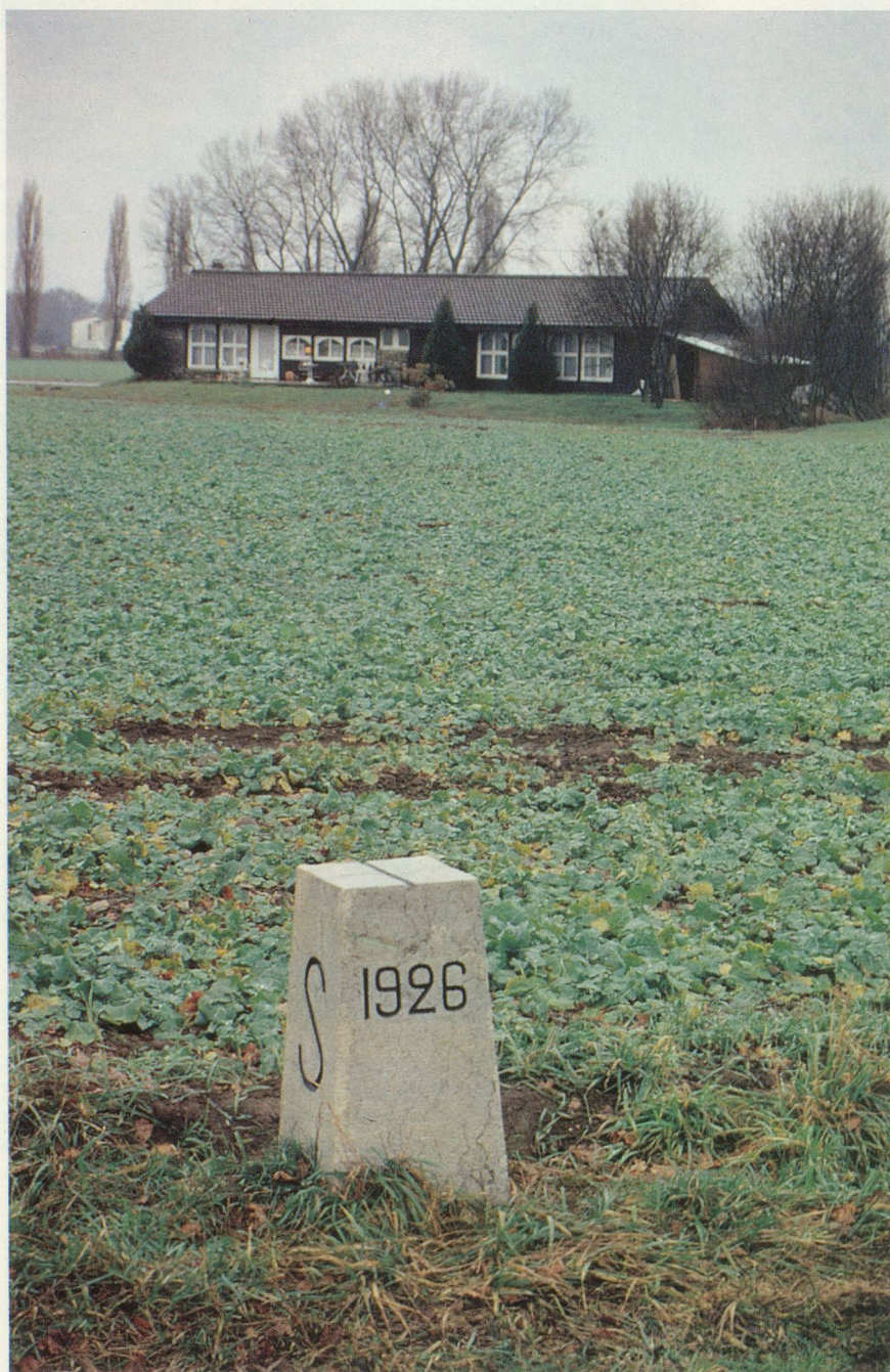
A quelques mètres de la frontière suisse, un pavillon scolaire est devenu une somptueuse villa.