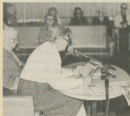
Le journal, une lecture prioritaire.

La lecture prévient le vieillissement de la mémoire et de l'intelligence; malgré les apparences, elle favorise aussi la vie sociale des personnes âgées. Pour ses vingt ans «Aînés» fait le point avec une étude du Ministère français de la culture.