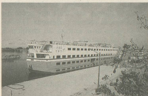
Le bateau-hôtel Sheraton

ordre. Visites de la Citadelle, du Bazar Khan El Khalili. Le lendemain, Musée national d'antiquités avec le trésor de Toutankhamon, pyramides de Guizeh, Memphis et Sakhara.