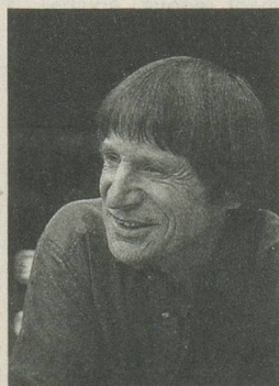
Dimitri, l'un des clowns les plus connus de Suisse nous a reçu dans sa maison de Bor- gogne.