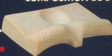
Montage anatomique en mousse aérée. Densité idéale.