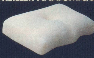
Enveloppe ouatinée dimensions : 54 x 34 cm.