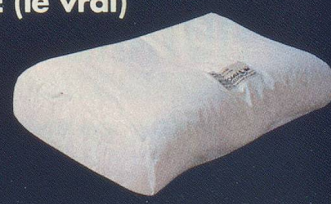
Le tout recouvert d'une housse coton longues fibres anti-allergiques.