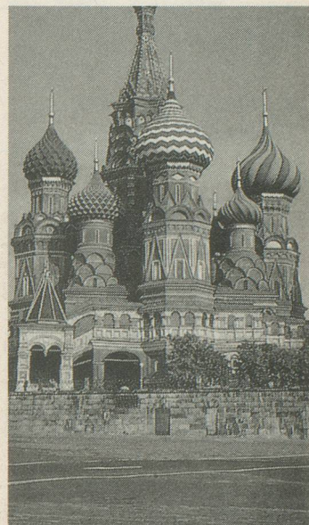
La cathédrale Saint-Basile, à Moscou.

Prix par personne: Fr. 1530.- tout compris (chambre 1 lit supplément Fr. 230.-). ■