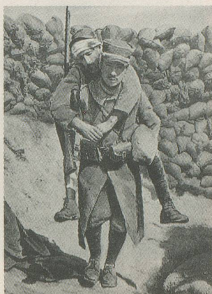
Les héroïques poilus dans leurs tranchées.

des Anglais de vaincre est inébranlable. Rappelons qu'au début de l'année, l'Allemagne, redoutant l'entrée en guerre des Etats-Unis, propose au... Mexique une alliance assortie de séduisantes promesses. Début avril, le tsar et sa famille sont arrêtés; ils ne seront pas épargnés. En Grèce, le roi Constantin abdique, permettant à Venizelos de revenir au pouvoir, ce qu'il fait en déclarant la guerre aux Allemands... En Russie, le vertige se prolonge. Elu par 20 millions de paysans, ouvriers et soldats, le 1 er Congrès des Soviets ne voit la victoire que d'une centaine de bolcheviks sur mille délégués. Kamenev et Trotski sont arrêtés et Lénine se réfugie en Finlande à la veille de la proclamation de l'indépendance de ce pays. Lénine revient bientôt secrètement à Petrograd, et en novembre, le 2 e Congrès des Soviets annonce que désormais les bolcheviks gouvernent, ceci au lendemain de l'assaut du Palais d'Hiver. A 76 ans, Georges Clemenceau, dit «Le Tigre», est porté au pouvoir à Paris; son nom restera pour toujours attaché aux prouesses de l'armée française. Que d'événements! Mais tout se précipitera dans quelques mois: la paix s'annoncera enfin, en