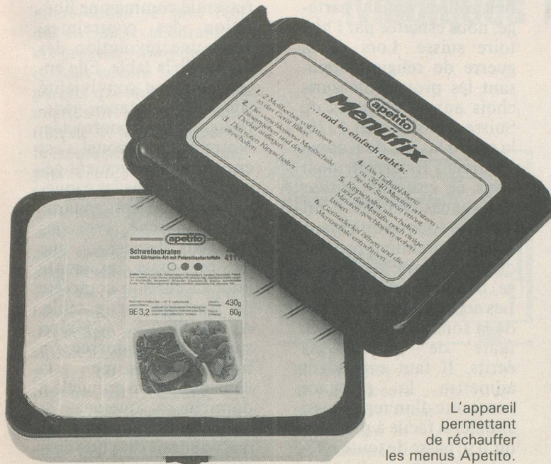
L'appareil permettant de réchauffer les menus Apetito.

60 menus proposés dans les pages du catalogue.