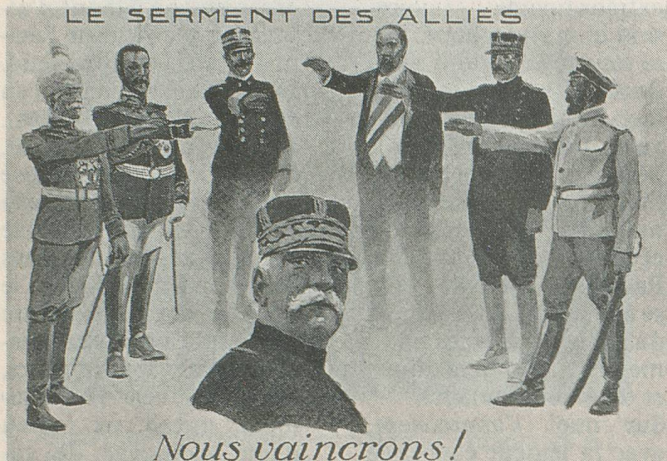
Le serment des Alliés: Nous vaincrons!

En août 1914, offensive française dans les Vosges.