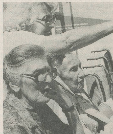
Entraide des âinés; un conseil, une indication peuvent suffire.