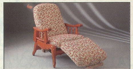
Everstyl «Elysée» fauteuil rustique

Notre catalogue gratuit vous présente un grand choix de modèles (rustique, contemporain, style) et de revêtements : velours, très beau cuir et cuir de synthèse. Finition « décoration », robustesse à toute épreuve : Everstyl est bâti pour défier le temps... Profitez de son prix « vente directe usine », dans toute l'Europe, sans intermédiaire.