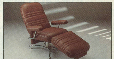
Everstyl «Trocadero» ligne mode contemporaine