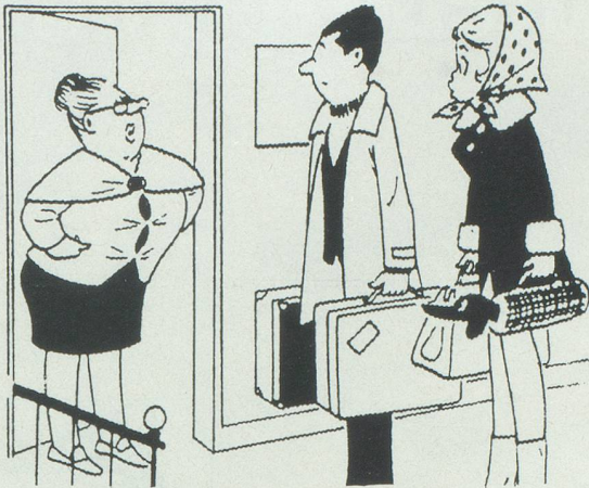
- Je parie que c'est pour ne pas donner d'étrennes que vous étiez absents depuis début décembre... Dessin de Caillé, Cosmopress Genève.