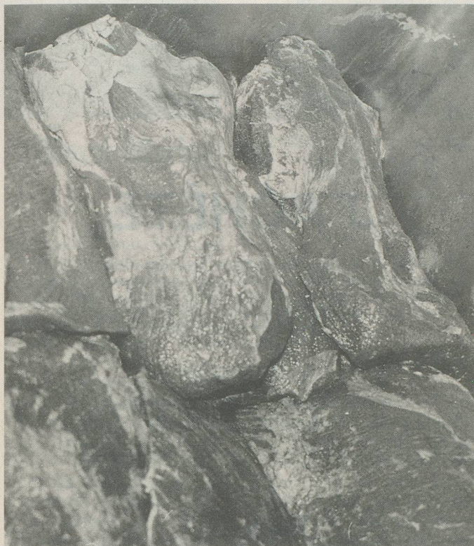
Ces morceaux de viande fraîche deviendront des plaques de viande séchée.

le sel et les arômes naturels les pénètrent en profondeur. Elles sont disposées dans des bacs et maintenues à + 8 et + 10 degrés pendant 12 jours. Comment se déroule l'étape suivante, donc l'étuvage? «L'étuvage comporte plusieurs phases pendant six jours. L'ambiance initiale est à + 30 degrés avec 95% d'humidité. Elle est progressivement ramenée à + 14 degrés et, tout à la fin, l'hygrométrie n'excède plus que 80%. Dans la salle réservée à cette opération, les pièces sont enveloppées de filets et suspendues individuellement à des réglettes disposées sur des chariots amovibles.»