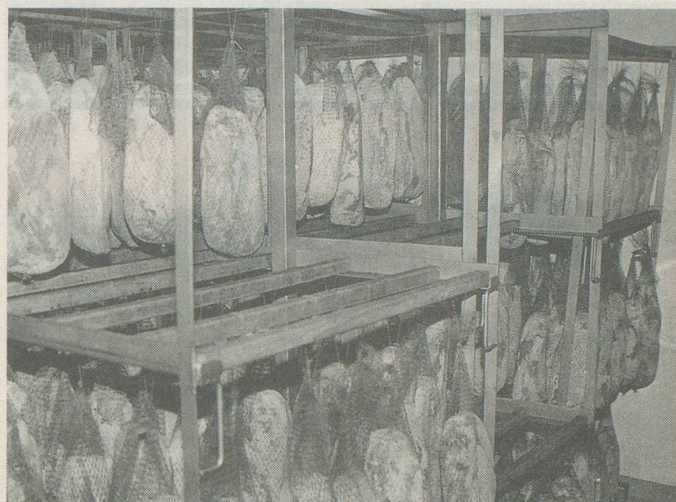
Au séchoir, la viande reste suspendue 60 jours.