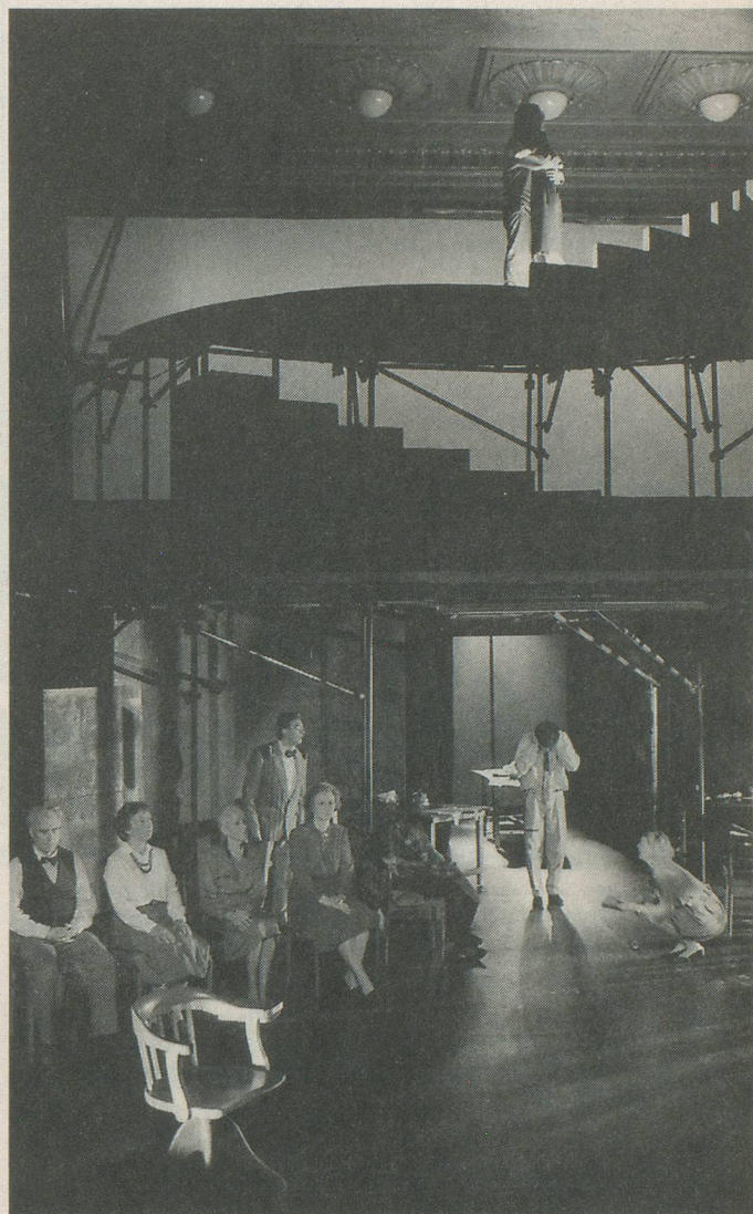
Du théâtre à tous les niveaux!

Pour certaines d'entre elles, c'était la révélation; «J'aurais toujours voulu faire du théâtre étant jeune», précise une autre, «C'est sympathique de jouer les uns avec les autres,» ajoute une troisième. Ou encore, «Le théâtre, ça nous rapproche» signale un comédien amateur. «Je n'aime pas le terme «amateur», renchérit aussitôt un autre, il faut dire bénévole, parce que nous sommes bel et bien des bénévoles du théâtre!» Et un troisième de préciser: «J'ai trouvé magnifique de suivre une pièce avec de vrais acteurs... surtout parce que nous la construisons!» Et la mémoire dans tout cela, que devient-elle? «Elle man-