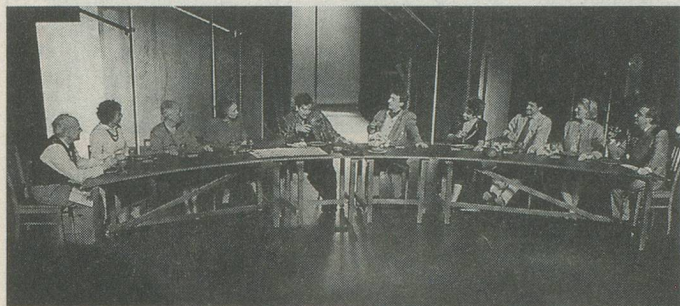
Le jour de la «première», le 15 mai, le repas de famille.

restés dans les rangs. Pourquoi moins d'hommes?