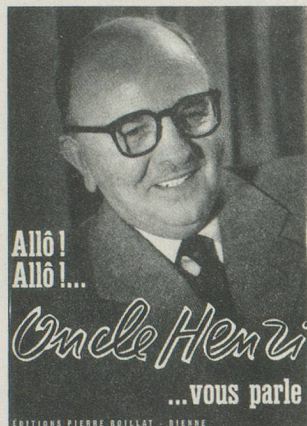
Le «Rendez-vous des benjamins» de l'Oncle Henri, des souvenirs de toute une époque, dans un livre publié en 1955.