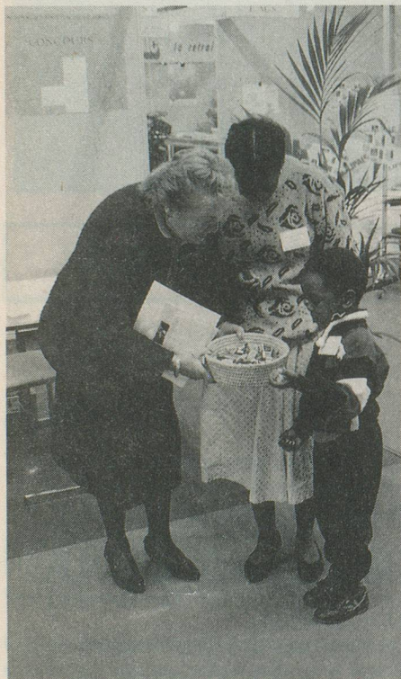
Le chocolat suisse, un moyen de nouer le dialogue