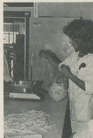
Le contrôle de qualité des frites en laboratoire est une opération délicate et indispensable.

pas compter seulement celui de la matière première en comparaison, mais bien, du moins en ce qui concerne les établissements publics, aussi le prix de la main-d'œuvre. En constatant l'économie de temps et même de personnel qui peut être réalisée grâce à la technologie alimentaire moderne telle que celle qui proposent les installations de Cressier. Les coulisses de la pomme de terre? C'est donc bien à la source que nous les avons trouvées: un espace étonnant où, comme sous le coup d'une