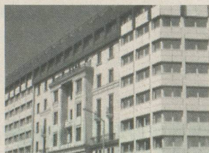
Votre hôtel Ungaria à Budapest.