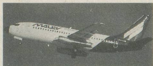
Le Boeing 737 de Malev au décollage.

Une semaine passionnante placée sous le signe de l'amitié. Le point culminant de ce voyage sera la rencontre dans la banlieue