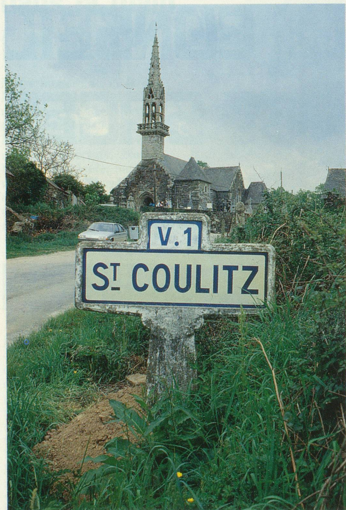
L'église de Saint-Coulitz. Aujourd'hui, les cloches sonnent.

Il est 15 h 30 lorsque le maire Kofi Yamgnane prend place avec 8 membres (sur les 9) du « Conseil des Sages » dans l'une des salles de la Mairie de Saint-Coulitz. Les sujets de conversation ne manquent pas: on commence par aborder un nouveau plan-cadre pour la construction des résidences secondaires... «Tout ce que vous voyez en couleur sur ce plan, précise le maire, c'est la zone que l'on a demandé en zone constructible, mais tout a été refusé!» Les faits sont clairs, les commentaires rares, il faut bien dire