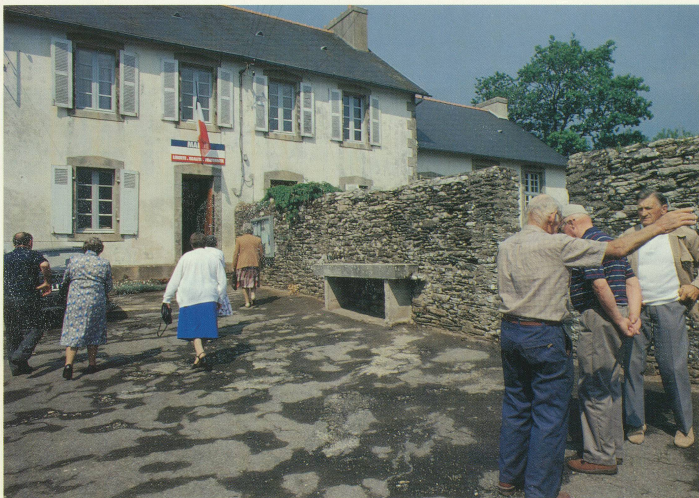
Les membres du Conseil se rendent à la mairie chaque premier samedi du mois.