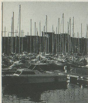
Le port des Embiez.

Un petit paradis en Méditerranée, à 12 minutes de bateau du port du Bruscat près de Sanary-sur-Mer. 95 hectares de pinèdes, garrigues, jardins fleuris et criques discrètes abritant des plages de sable fin. 300 jours de soleil par an. Mer merveilleusement limpide. Pas de circulation motorisée sur l'île. Commerces, restaurants, bars, glaciers, maison de la presse, etc. Médecin à demeure sur l'île.