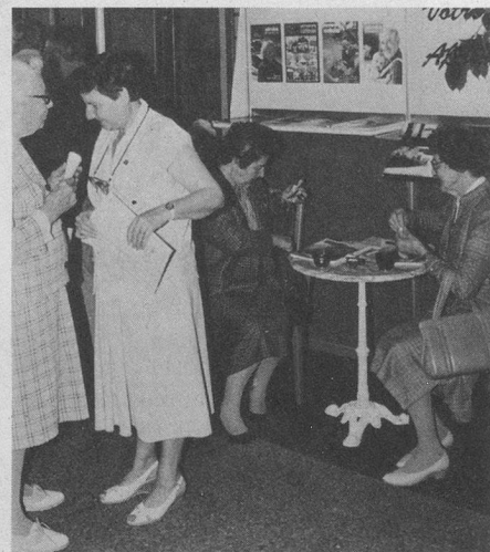
L'ambiance sur le stand Pro Senectute.