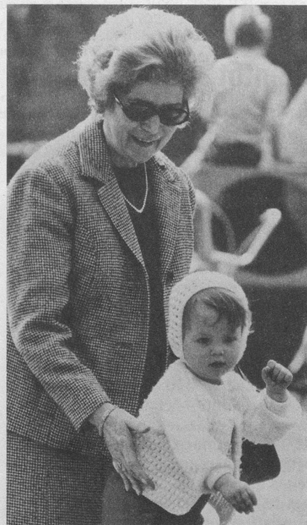
Il sorriso di una nonna ringiovanita nel contatto con bambini.

Le telefonate delle candidate nonne all'Ufficio Stampa di Pro Senectute Ticino (Lugano tel. 091/23 19 46) hanno rivelato molta solitudine, molta disponibilità a dare aiuto e conforto agli altri, una comprensione per le difficoltà delle giovani famiglie nata