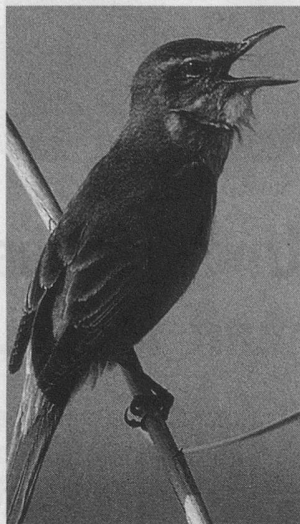
La rousserolle turdoïde chante dans l'épaisse roselière pour y attirer une femelle et pour en éloigner ses rivaux.

Le rossignol, le coucou, les hirondelles et les martinets en dernier. Après avoir passé l'hiver en Afrique loin du froid, ils reviennent se reproduire chez nous. Depuis les premiers jours de février déjà, le chant des étourneaux nous égaie. Les merles, les alouettes et les pinsons ont commencé à chanter dès les premiers signes du printemps en mars. Le concert des oiseaux est-il à nouveau aussi beau et aussi riche que l'an passé?