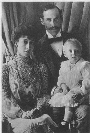
Haakon VII roi de Norvège avec son fils et successeur, Olaf, sur le trône depuis 32 ans.