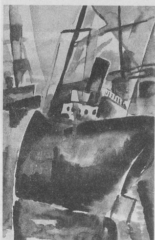
Le Cargo échoué au Port, aquarelle, 1928.

Editions du Verseau, Roth & Sauter, Denges