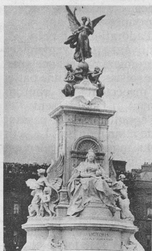
Inauguration du Mémorial de la reine Victoria à Londres. Document extrait de la collection J.-P. Cuendet, St-Prex.