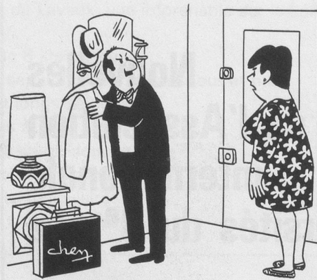
- Ça me suffit d'entendre râler mon patron; lui, il me paye pour ça! Dessin de Chen, Cosmopress Genève.

Ne pas utiliser ce coupon pour le renouvellement de l'abonnement svp.