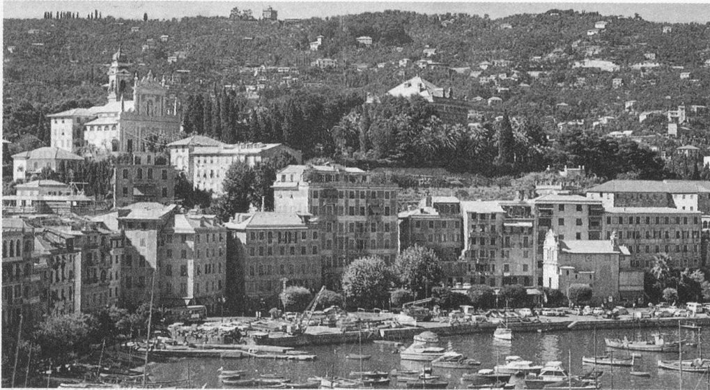
Santa Margherita, Costa del Liguria.