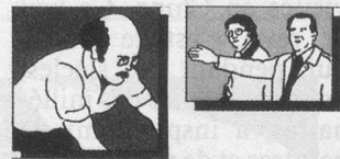
Arthrose, arthrite, rhumatisme, douleurs dans les épaules et la nuque, douleurs musculaires.

prolongé, il représente la possibilité de diminuer l'emploi et la quantité de médicaments qui, dans certains cas, deviennent difficiles à supporter.