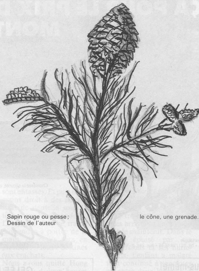
Sapin rouge ou pesse; Dessin de l'auteur

Le sapin est plus coopératif à l'hôpital qu'à la cuisine. Ses bourgeons sont moins recommandés que ceux de son cousin: le pin. Mais en tisane – 25 g dans un litre d'eau – ou en sirop dans l'eau de vie, ils sont diurétiques et soignent les maladies des voies respiratoires – des catarrhes bronchiques à la grippe. En homéopathie, le sapin du Canada traite l'atonie digestive, la ptôse stomacale, la métrite chronique.