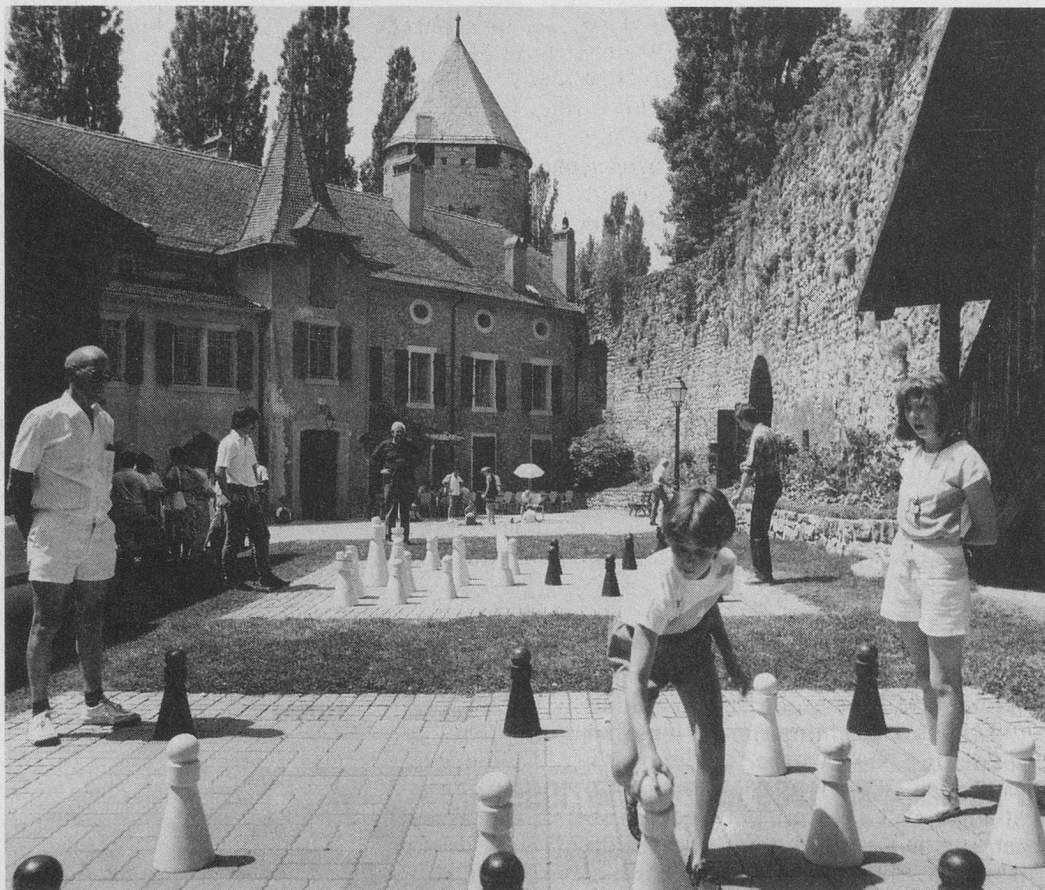
On joue même dans la cour du château!

Parcours fléché obligeant, le Musée suisse du Jeu, c'est aussi le Château de La Tour-de-Peilz qui l'abrite. Une demeure médiévale construite par les comtes de Savoie, avec ses deux tours, son enceinte, ses remparts et son fossé d'origine, a traversé les siècles sans trop d'encombres, et s'est transformée en temple des jeux – est-ce déjà un jeu? Pas vraiment, après l'achat du château par la Commune en 1979, l'espace est sérieusement redéfini. Les salles du premier étage, entièrement rénovées et parées d'originales vitrines de forme py-