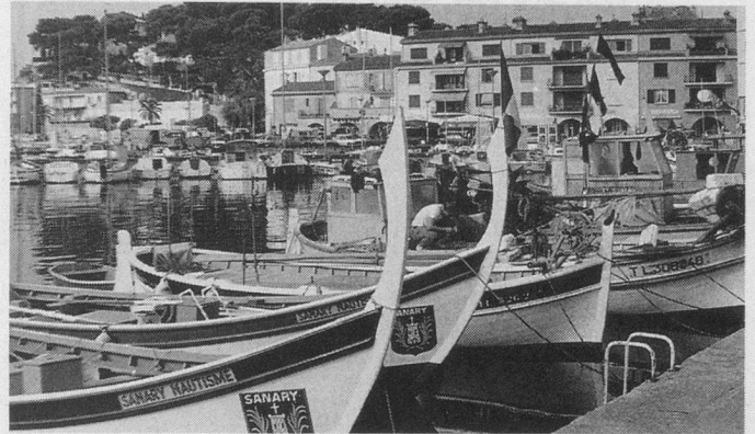
Le port de Sanary

«Aînés» et Wagons-Lits Tourisme vous proposent ce magnifique voyage-croisière pour le prix de Fr. 1995.- par personne, vols, croisière, pension complète et visites. Billets CFF 1 re classe gratuits du domicile à Zurich et retour. Voyage accompagné, guides pour les visites. Le nombre de places étant limité, il est conseillé de réserver dès que possible. Un inoubliable circuit; un merveilleux cadeau de Noël offert à un prix sans concurrence vu la qualité des prestations.