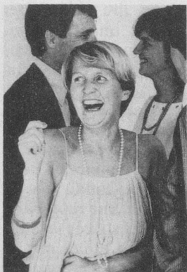
En Suisse, plus de 200 000 femmes et hommes souffrent, à des degrés divers, d'incontinence d'urine.

Beaucoup de personnes voudraient mais n'arrivent pas à maîtriser les problèmes d'hygiène que leur pose l'incontinence d'urine.