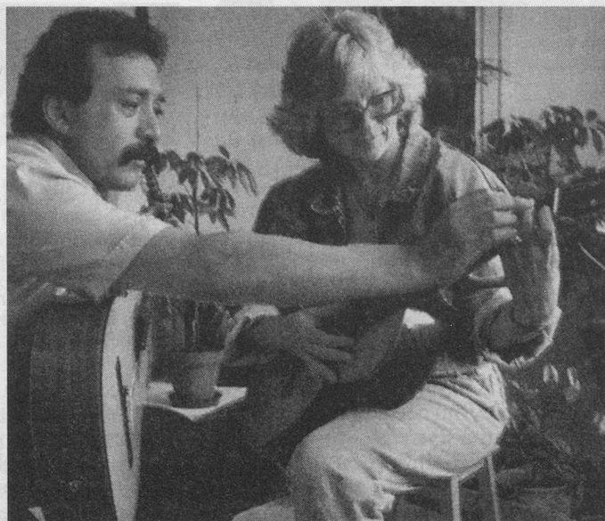
Le Troc-Temps, c'est l'offre et la demande des compétences de chacun.