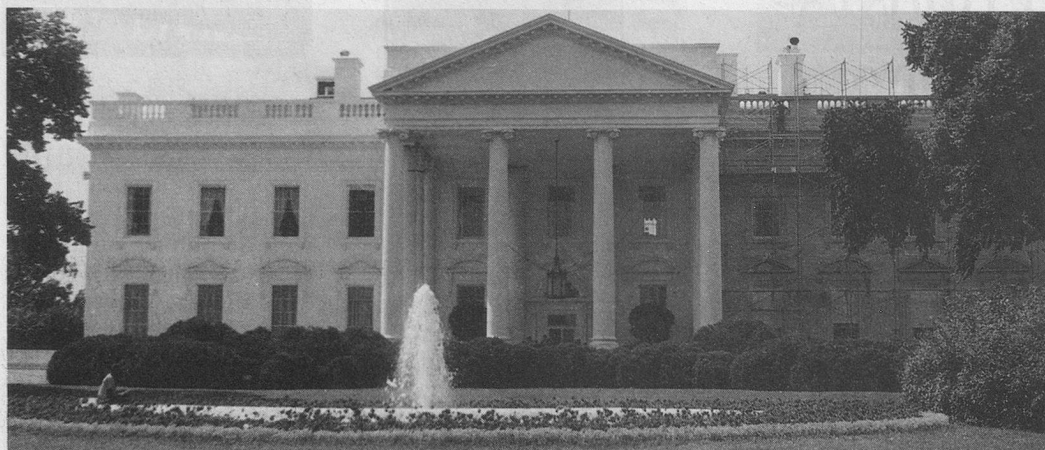
Un prestigieux bâtiment: la Maison-Blanche.