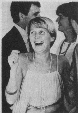
En Suisse, plus de 200 000 femmes et hommes souffrent, à des degrés divers, d'incontinence d'urine.

Beaucoup de personnes voudraient mais n'arrivent pas à maîtriser les problèmes d'hygiène que leur pose l'incontinence d'urine.