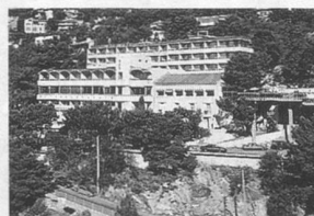
La vue de l'hôtel Altaea.

15 jours à l'Hôtel Palm'Tech*, en ch. 2 lits