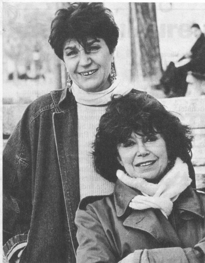
Anne Sylvestre et Pauline Julien, dans l'émission «Gémeaux croisés».

Etes-vous d'accord avec moi: le jazz reste le parent pauvre de la TV (suisse ou française). Faut-il le regretter? Pas trop, sans doute, à nos âges, bien qu'il ait tenu une place dans nos jeunes années!