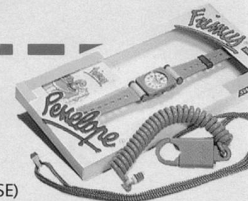
FRIMUS (BLEU) POUR GARÇONS