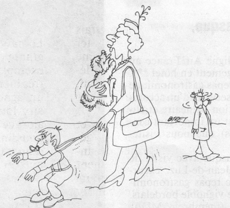
Sans paroles. (Dessin de Biret, Cosmopress, Genève)