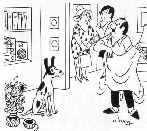
...Nous avons passé nos vacances en Espagne!... Dessin de Chen (Cosmopress Genève)