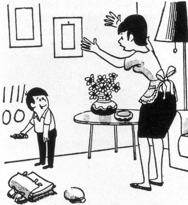
– Regarde ce que j'ai appris à l'école! (Dessin de Chen, Cosmopress Genève)