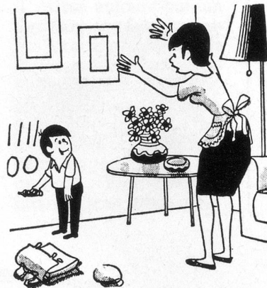
– Regarde ce que j'ai appris à l'école! (Dessin de Chen, Cosmopress Genève)