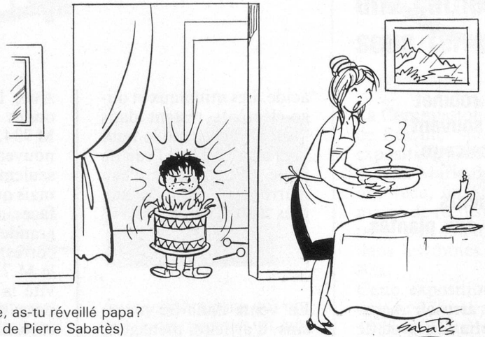
– Pierre, as-tu réveillé papa? (Dessin de Pierre Sabatès)

Ne pas utiliser ce coupon pour le renouvellement de l'abonnement svp.