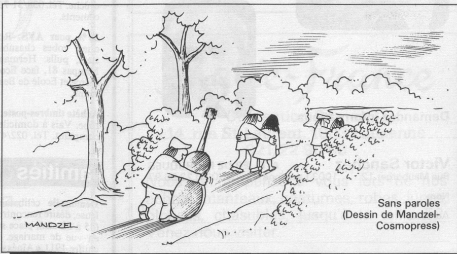
Sans paroles